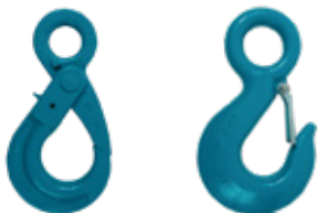
GANCHOS CON OJO GRADO 80