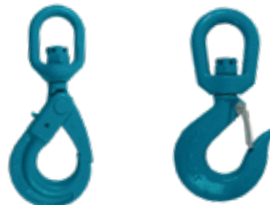
GANCHOS GIRATORIOS GRADO 80