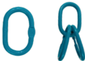
ARGOLLAS GRADO 80