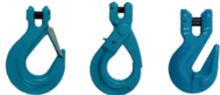
GANCHOS CON CLEVIS GRADO 80